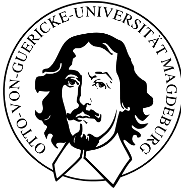
Abbildung: Altes Logo der Universität